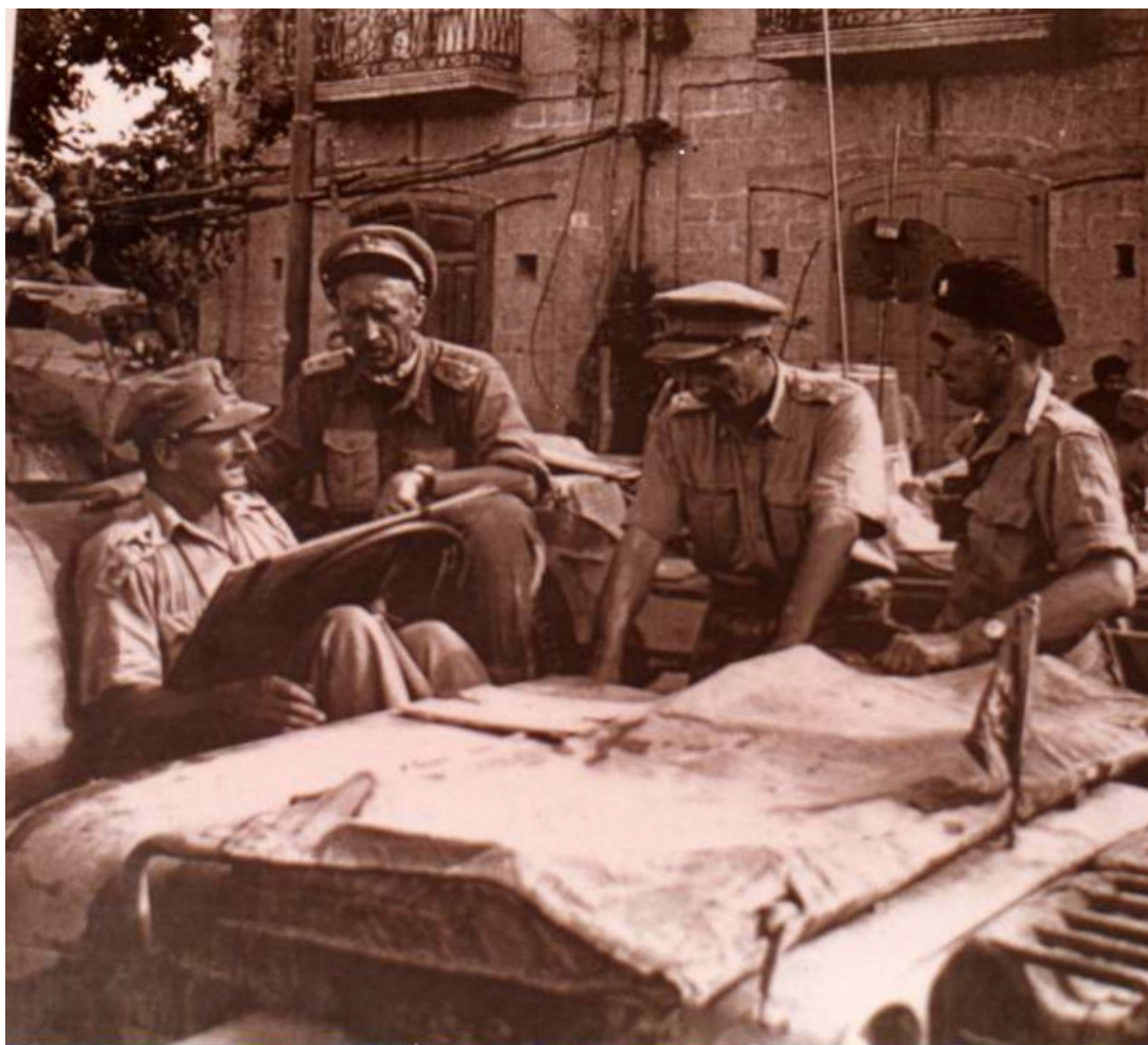
Figura 2 Ufficiali britannici alla "Croce del Sud"

28 settembre : “On the ground in Italy, the US Fifth Army is ready for an assault on Naples and Avellino. Castellammare di Stabia, Nocera and Sala Consilina are taken.” (CC of USAAF).