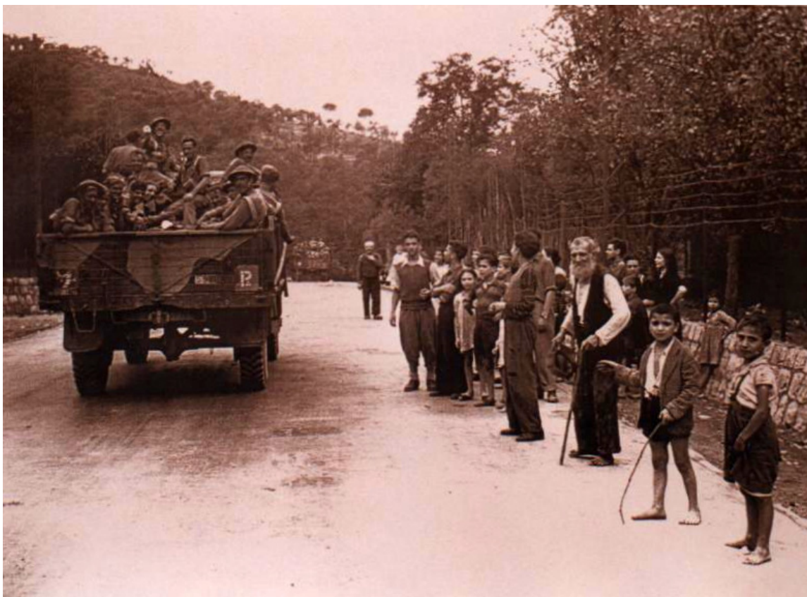
Figura 3 Passaggio di truppe britanniche sulla nazionale, a Capocasale

29 settembre : Le truppe inglesi marciano verso Sarno e verso Scafati, lasciando Nocera nella più serena calma (Capp.). Dai corridoi di Vietri e di Cava scendevano a grande velocità camions, jeeps, motociclette, percorrevano il Corso e imboccavano, quando vi riuscivano, la via di Sarno e di Pompei (D. Rea).